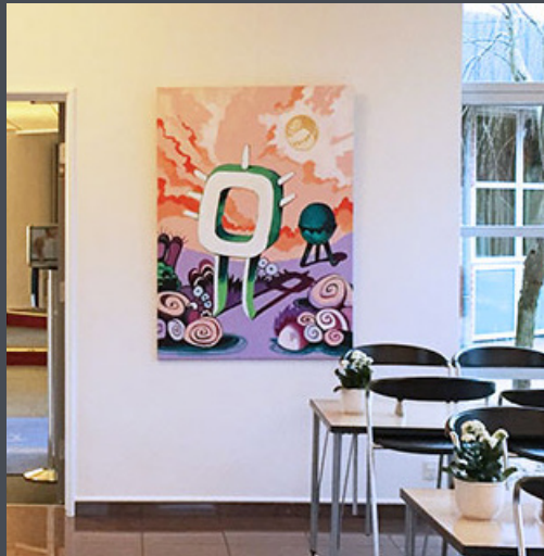
Camtric Joy/ 140 x 100 cm