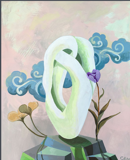
Delicate cohesion/ 100 x 80 cm