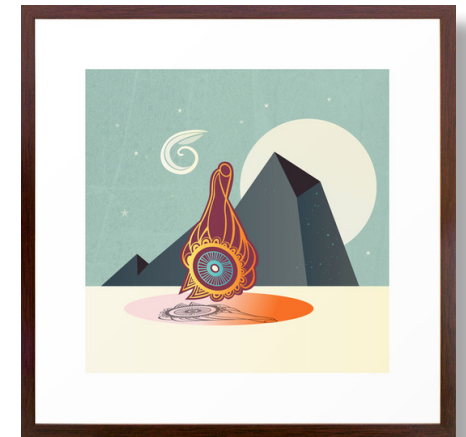
The Zodiac vektor grafik