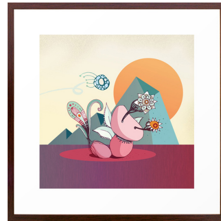
Fly by vektor grafik