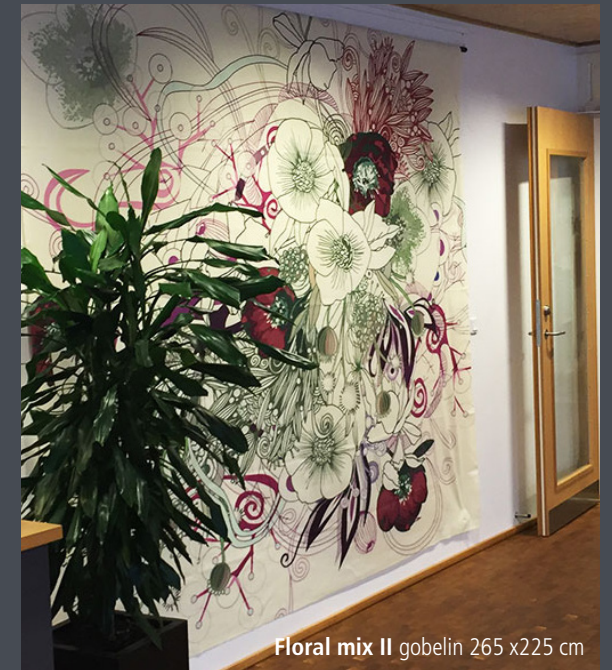
Floral mix II gobelin 265 x225 cm