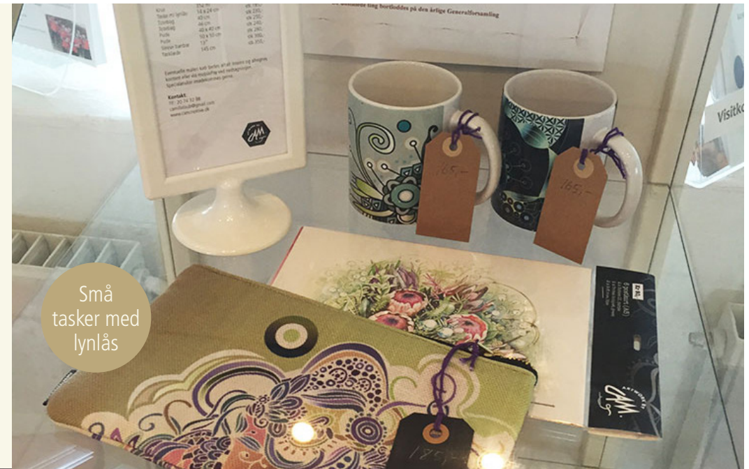
Små tasker med lynlås

En udstilling kan således krydres med et udvalg af produkter på tekstiler, porcelænen og store stof-gobeliner.